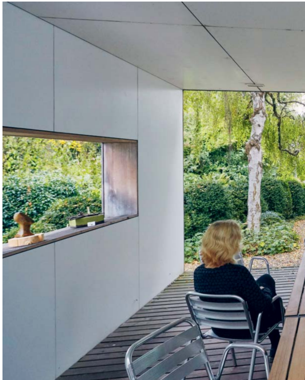
Patientin in einer psychiatrischen Klinik.